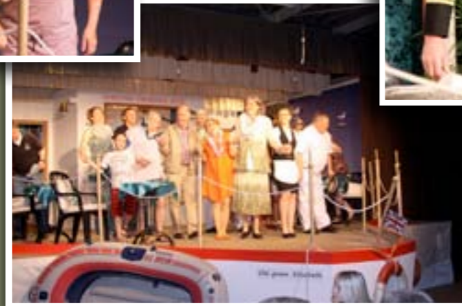
15 février 2012 Cabarenert