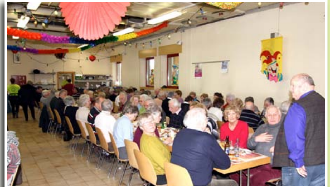
25 février 2012 Buergbrennen (Club des Jeunes)